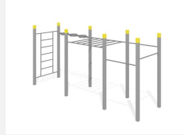
SWC.4560 Streetworkout 560