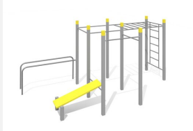
SWC.4564 Streetworkout 564