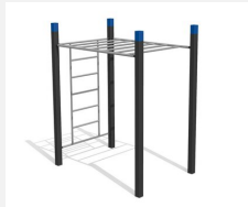
SWC.4254 Streetworkout 254