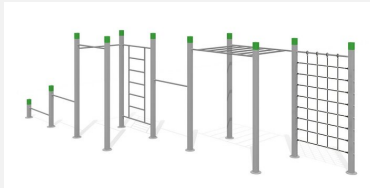
SWC.4258 Streetworkout 258