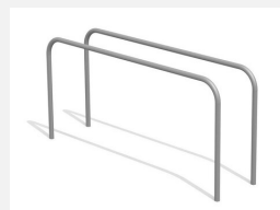
SWC.4354 Barres parallèles 354