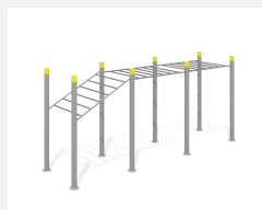
SWC.4262 Streetworkout 262