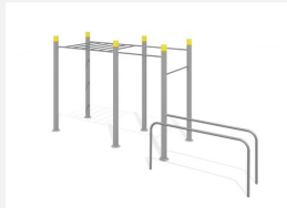
SWC.4260 Streetworkout 260