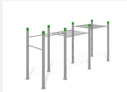
SWC.4256 Streetworkout 256