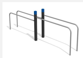
SWC.4353 Parallel Bars 353