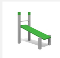
SWC.4113 Banc incliné 113 - Modèle