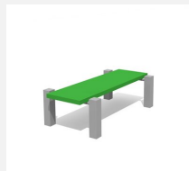
SWC.4112 Bench 112