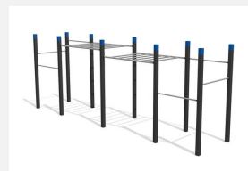
SWC.4253 Streetworkout 253