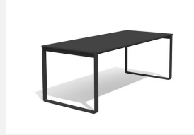
BT.161.T Table Quo duro