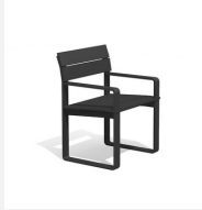
BT.161.SA Chaise Quo duro avec accoudoirs