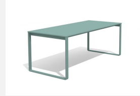
BT.161.T.C Table Quo duro color