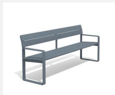
BT.161.BA.C Banc Quo duro avec accoudoirs, color