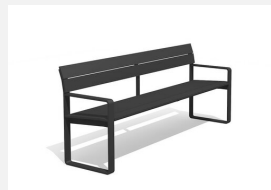
BT.161.BA Banc Quo duro avec accoudoirs