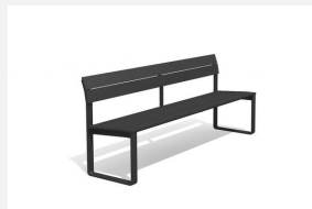
BT.161.B Banc Quo duro