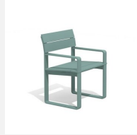
BT.161.SA.C Chaise Quo duro avec accoudoirs