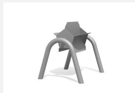
SW.146.11 Roue à eau simple avec double arceau