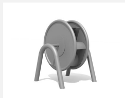
SW.146.31 Roue à eau fermée avec arceau double