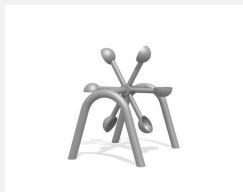
SW.146.20 Roue à eau cuillère 6 avec arceau double