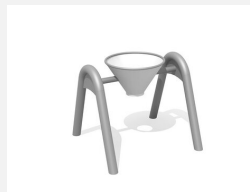
SW.146.40 Seau pivotant avec arceau double