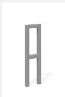
DI.105.22.I Appuis vélos Pura 25.2