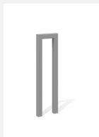
DI.105.12.I Appuis vélos Pura 25.1