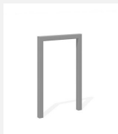
DI.105.15.I Appuis vélos Pura 55.1 inox