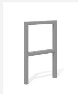
DI.105.25.I Appuis vélos Pura 55.2 inox