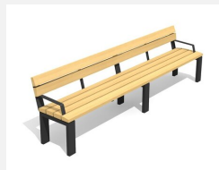
BT.041.BA3.C Banc Arco avec accoudoir 300 color