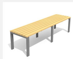
BT.041.T3 Table Arco 300