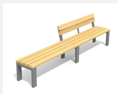
BT.041.HB3 Banc avec dossier partiel 300