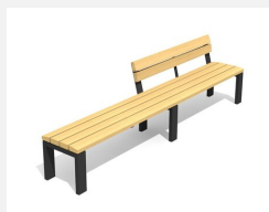
BT.041.HB3.C Banc avec dossier partiel 300 color