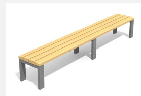
BT.041.H3 Banc Arco sans dossier 300