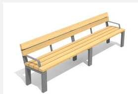
BT.041.BA3 Banc Arco avec accoudoir 300