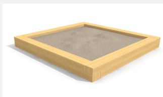
SW.014.30.H Bac à sable haut 3.0 x 3.0 m en bois dur