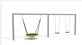
SC.162.32.I Combiné balançoire rectangle - nid d'oiseau inox