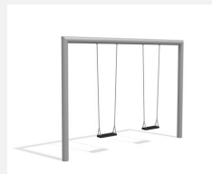
SC.160.2.I Balançoire rectangle 2 places inox