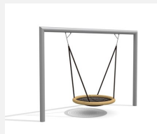
SC.162.3.I Nid d'oiseau rectangle inox