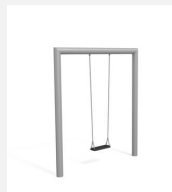
SC.160.1.I Balançoire rectangle 1