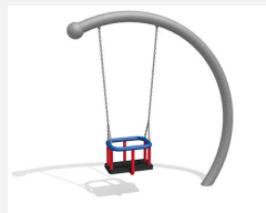
SC.150 Balançoire demi-lune (pour les petits)