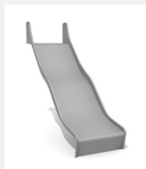
RU.093.20.W.B bimbo toboggan de