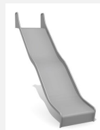
RU.093.25.W.E bimbo toboggan de