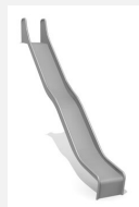
RU.093.25.V bimbo toboggan