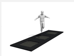
FA.093.13 Cadre en métal à enterrer trampoline S3