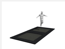
FA.090.12 Cadre en métal à enterrer trampoline M2