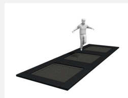
FA.090.13 Cadre en métal à enterrer trampoline M3