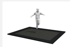
FA.090.14 Cadre en métal à enterrer trampoline M4