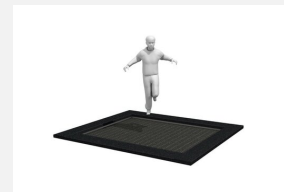
FA.092.9 Cadre en métal à enterrer trampoline L