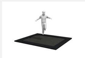
FA.092.1 Trampoline L à enterrer