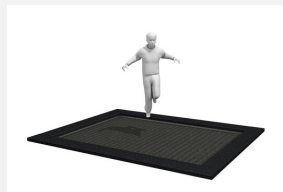
FA.091.9 Cadre en métal à enterrer trampoline XL