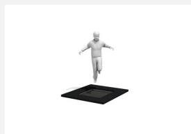
FA.093.01 Trampoline Sb à enterrer