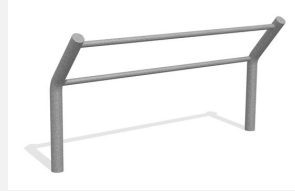
DI.032.20 Kickbar 3, 200 cm