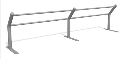
DI.031.40 Kickbar 2, 400 cm