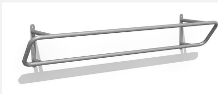
DI.030.25 Kickbar 1, 250 cm