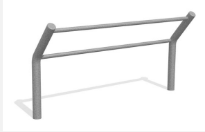
DI.032.20 Kickbar 3, 200 cm