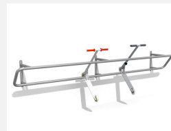
DI.030.35 Kickbar 1, 350 cm