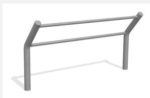
DI.032.20 Kickbar 3, 200 cm