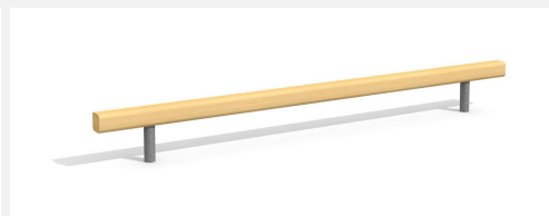
BA.020.3 Poutre d'équilibre plane 30 cm