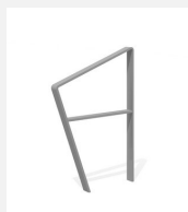
DI.108.26.I Fahrradbügel Areo 65.2 inox