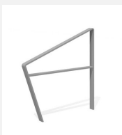
DI.108.29.I Fahrradbügel Areo 95.2 inox