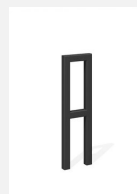
DI.105.22.C Fahrradbügel Pura 25.2