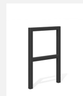
DI.105.25.C Fahrradbügel Pura 55.2 color