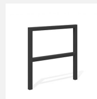
DI.105.28.C Fahrradbügel Pura 85.2 color