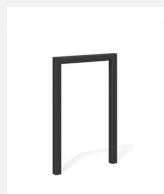
DI.105.15.C Fahrradbügel Pura 55.1 color