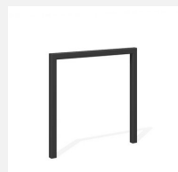
DI.105.18.C Fahrradbügel Pura 85.1 color