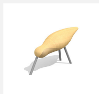
BN.310.2 Der Spatz