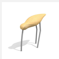
BN.310.4 Der Storch