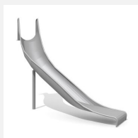
RU.103.20.L Schalenrutsche links 45°, 200 cm