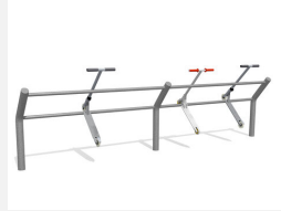
DI.032.40 Kickbar 3, 400 cm