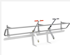
DI.030.35 Kickbar 1 Wand, 350 cm