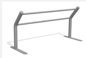
DI.031.20 Kickbar 2 , 200 cm