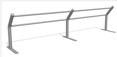
DI.031.40 Kickbar 2, 400 cm