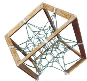
The Cube L