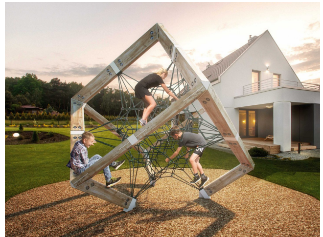
The Cube M